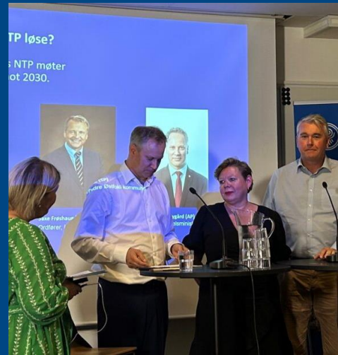
Arendalsuka 16. august: Kan NTP bli en plan for å nå klimamål og bidra til økt konkurransevne for næringslivet?