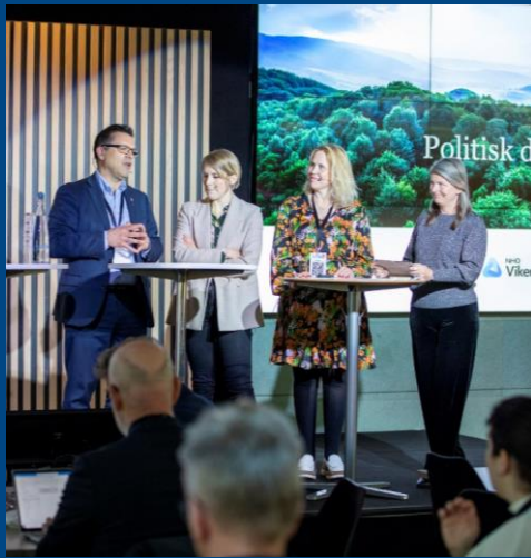
NTP-konferanse 4. mai, samarbeid med NHO Viken Oslo, LO Oslo Akershus og Østlandssamarbeidet