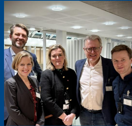
Møte med statsekretær Cecilie Krog Lund i SD 18.1.