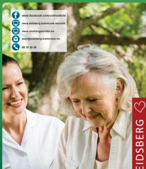
USHT Østfold sin roll-up