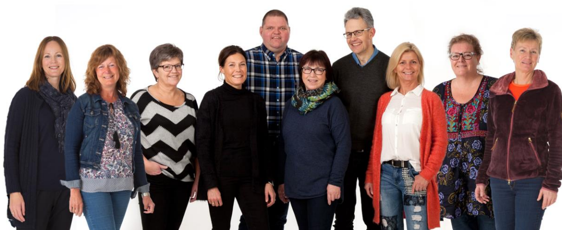
ANSATTE, USHT ØSTFOLD 2019