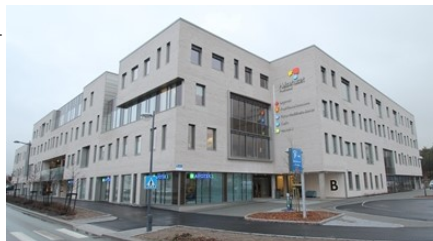
Helsehuset på Kråkerøy