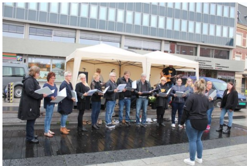
«Catch» på Verdens overdosedagen 2017