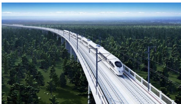
Slik bygges lyntogbaner i dag.

Indre Østfold-samfunnet kan stå foran omkalfatrende inngrep og formidable naturendringer i årene som kommer. Naturvernforbundet viser til planene om Skagerakbanen - lyntog Oslo-Gøteborg og lyntogprosjektet Oslo-Stockholm. Skagerakbanen vil skjære tvers igjennom Hobølmarka og den sørvestlige delen av turområdene Spydeberg. Pillarbruene vil skjære gjennom Indre Østfold som en Y. Spydeberg vil også kunne få en lyntogbane nummer to gjennom seg, dersom Oslo-Stockholm også legges gjennom Indre Østfold.