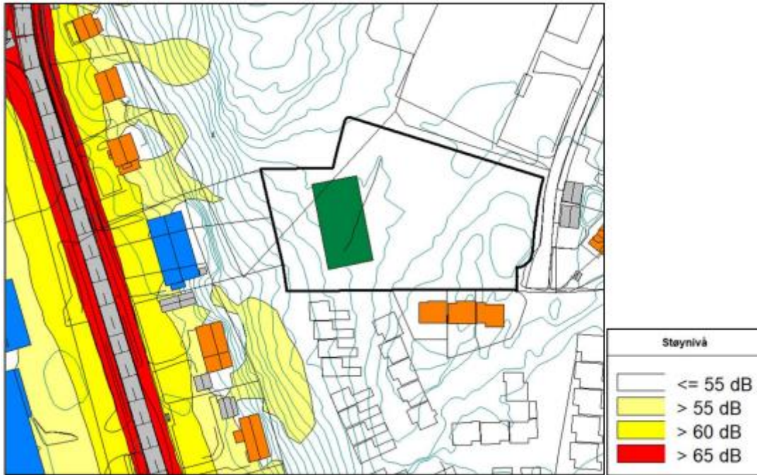
Figur 2: Figur fra støynotat viser et støynivå under 55 dB på utearealet. Nord er opp på figuren, verst mulig plassering av bygg er også undersøkt, det er ikke nødvendig med tiltak mot støy på fasaden her